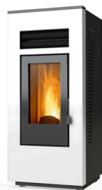
BIANCO COD: G0002-SPAV-EU-RLBCO-01