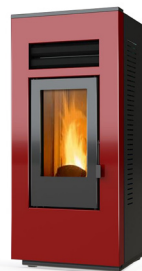
BORDEAUX COD: G0002-SPAV-EU-RLBDX-00