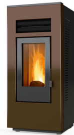
BRONZO COD: G0002-SPAV-EU-RLCRN-00